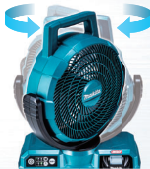
自動で左右45°、手動で90°角度調整可能