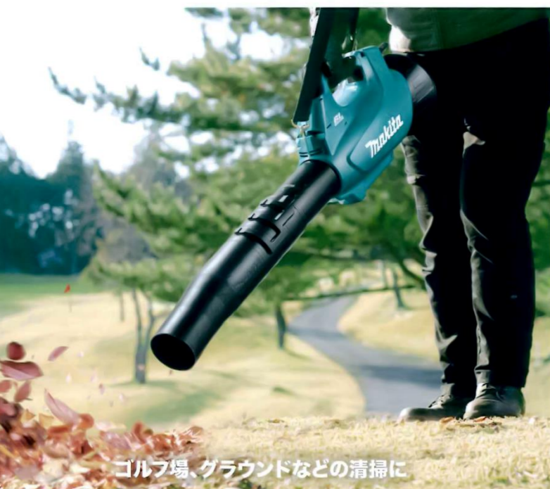
ゴルフ場、グラウンドなどの清掃に