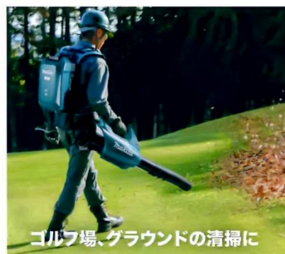
ゴルフ場、グラウンドの清掃に