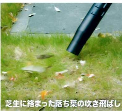
芝生に絡まった落ち葉の吹き飛ばし