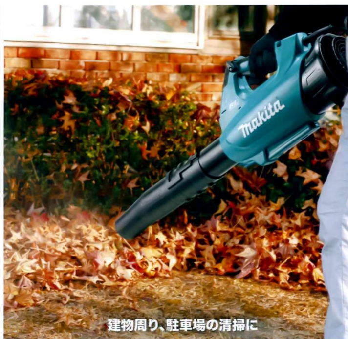
建物周り、駐車場の清掃に