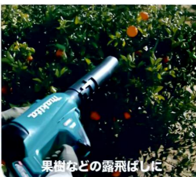
果樹などの露飛ばしに