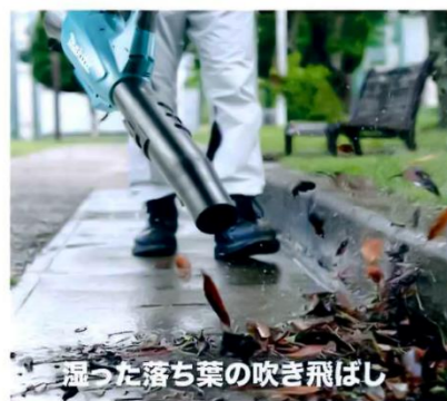
濡った落ち葉の吹き飛ばし