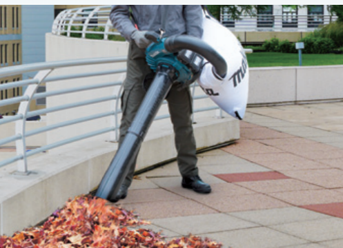
建物周りや屋上庭園等の清掃に