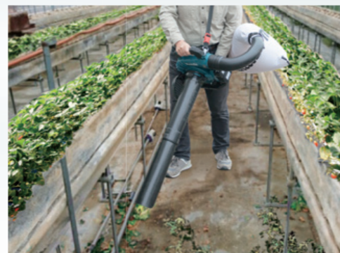
ハウス内の清掃に