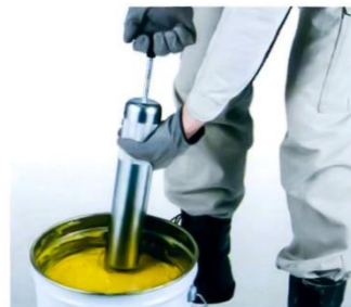
バレルへ直接充填