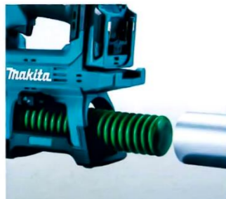
カートリッジで充填